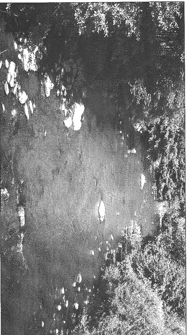
L'Alagnon à Auzit de Molompize

La dernière ligne droite de l'élaboration du SAGE correspond aux étapes de consultation des assemblées et d'enquête